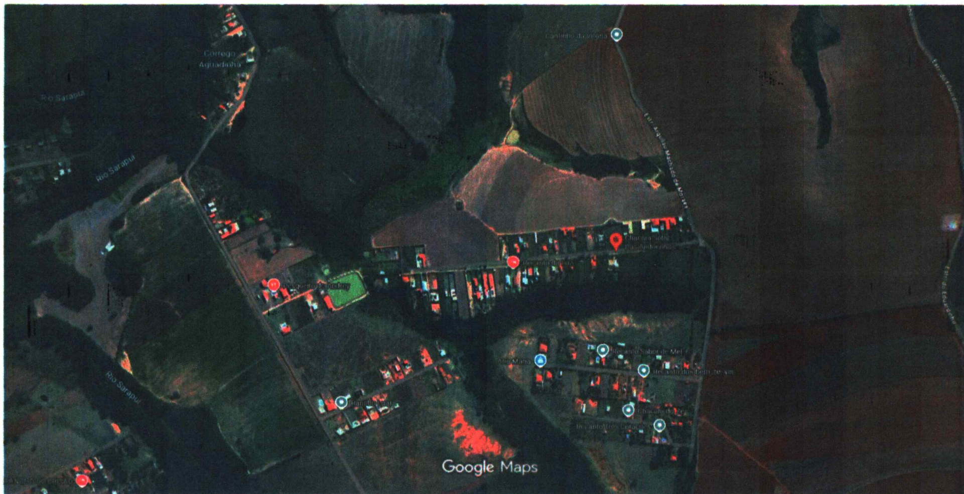
Imagens ©2026 Airbus, Maxar Technologies, Dados do mapa ©2026 100 m