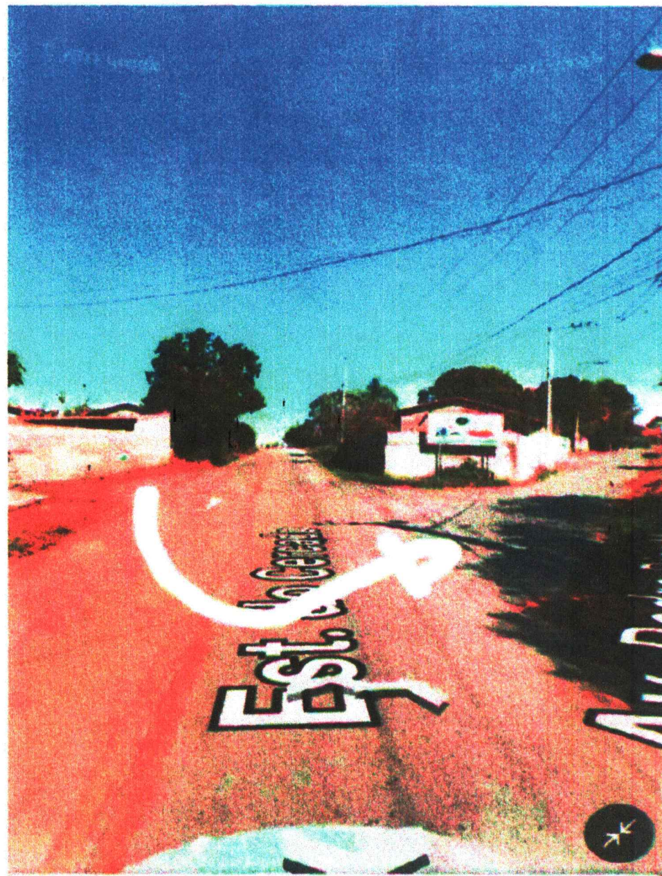
501 Est. do Cercado